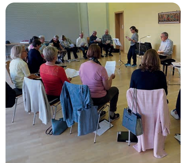
Der Kirchenchor in Aktion

„In einer Zeit, in der Mauern entstehen, bauen wir Brücken.“